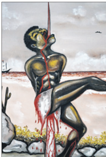
Tula. Pastel van Edsel Selberie.